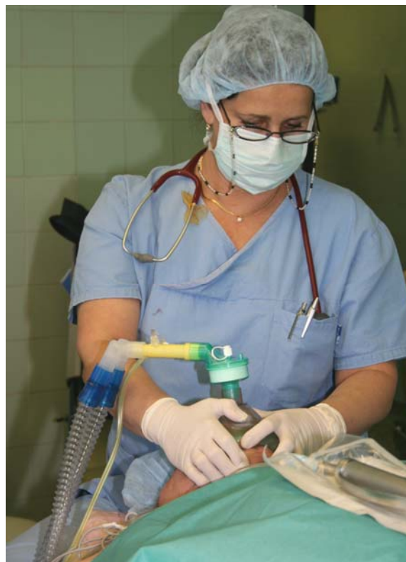
3. kép: Általános érzéstelenítés (narkózis)

Szükség lehet továbbá izomlazító (relaxáns) adására, amely megkönnyíti az intubációt és a lélegeztetést, javítja a műtéti feltárás körülményeit és csökkenti az altatószerigényt.