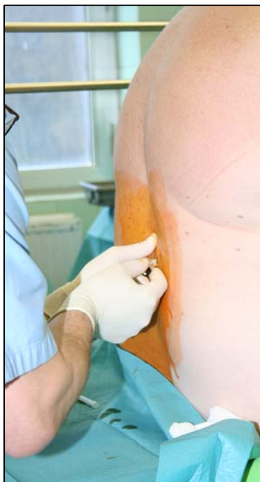
1. kép: Spinális érzéstelenítés

Az érzéstelenítőt befecskendezzük a gerincvelői folyadékba – ezt nevezzük spinális érzéstelenítésnek (1. kép). Az érzéstelenítés megkezdése előtt fertőtlenítő folyadékkal lemossuk a bőrt a gerinc ágyéki szakaszán, majd a tűszúrás leendő helye körüli bőrfelületet érzéstelenítjük. Ez után kerül sor az injekciós tű gerincvelői folyadékba történő bevezetésére. A gerincoszlop azon részén, ahol gerincvelő már nem található, csak gerincvelői folyadék. Spinális érzéstelenítés esetén a test deréktól lefelé érzéketlenné válik.